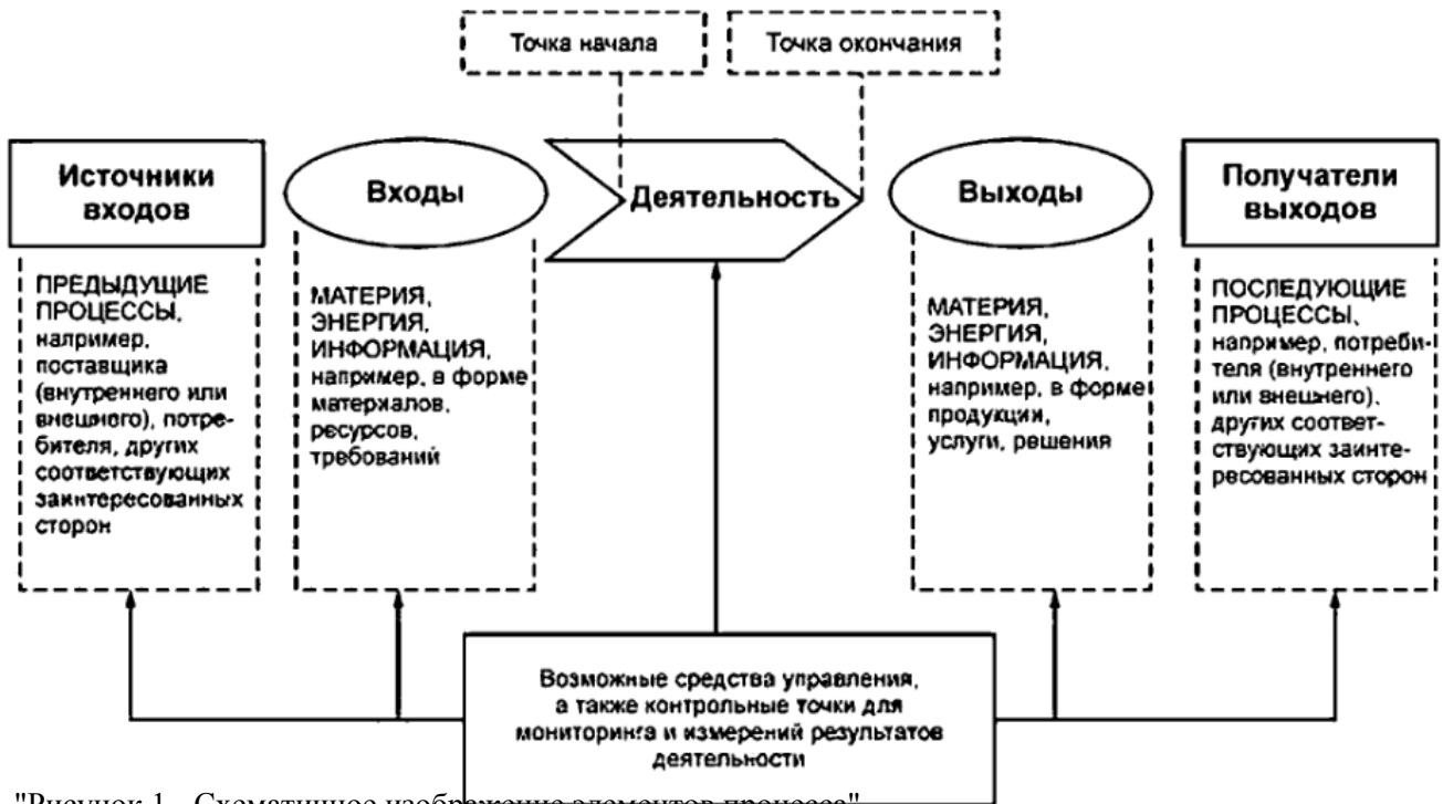
"Рисунок 1 - Схематичное изображение элементов процесса"